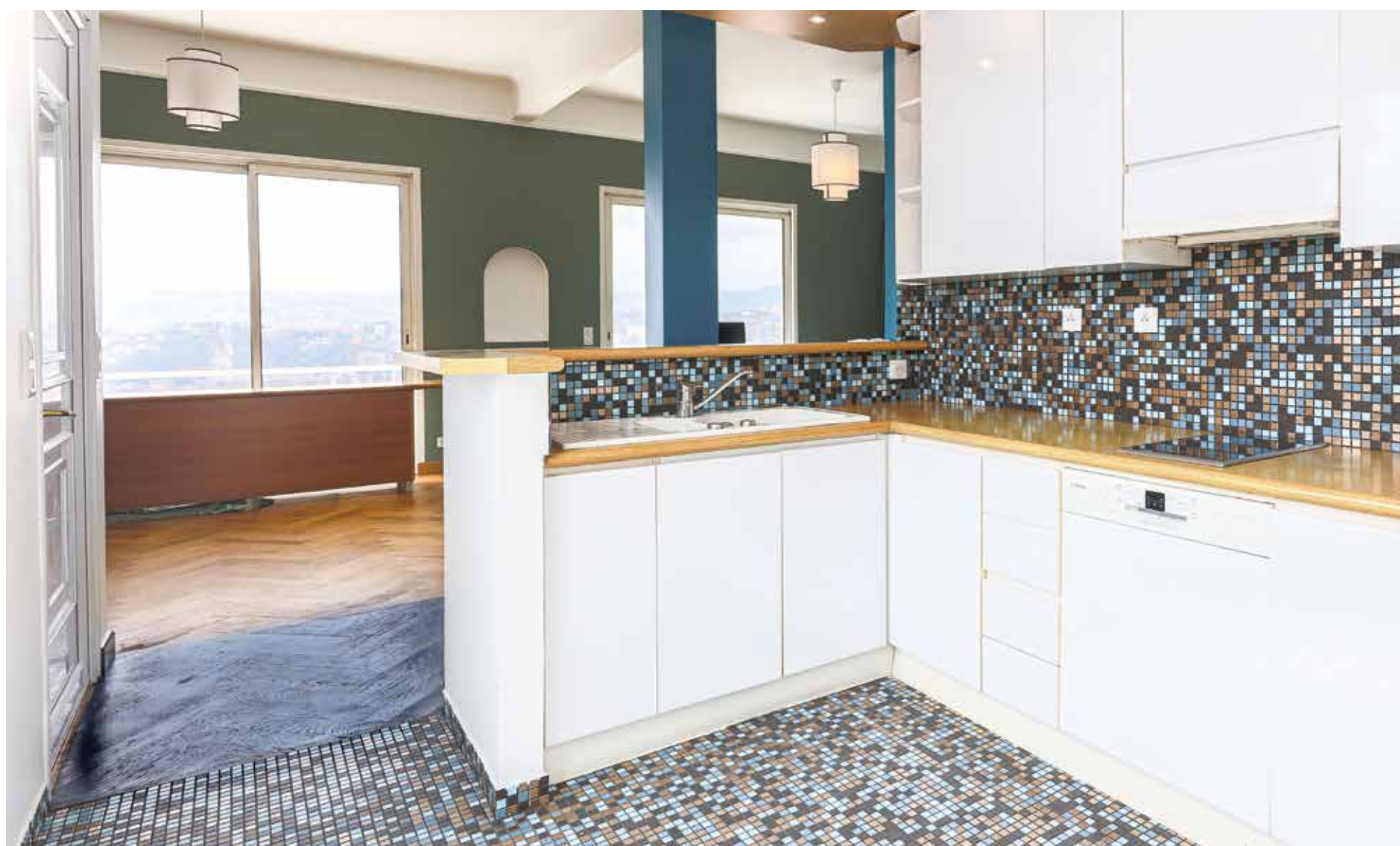
Travaux réalisés par Kevin Dellac, Omnibat BTP.